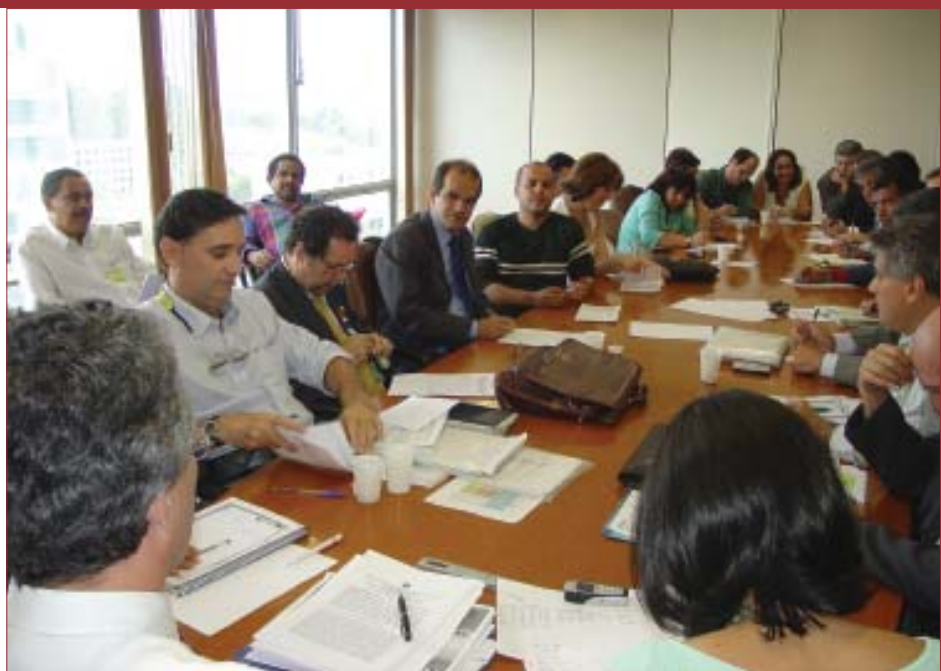
Governo eleva orçamento para a carreira de C&T na última reunião com o Fórum. O reajuste de 15% trará um impacto de R$ 275 milhões no orçamento para 2006