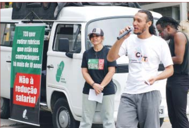
A campanha salarial de C&T sempre foi um dos principais pontos de nossa pauta de reivindicações