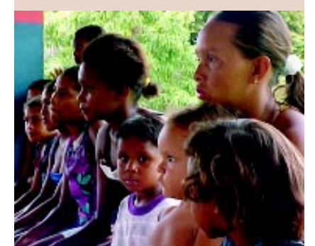
Em algumas comunidades há uma miscigenação elevada, principalmente descendentes de cearenses

Luciano - São semelhantes aos Distritos Sanitários Indígenas formados pelo Governo Federal, sob a responsabilidade da Funasa. O que a gente está propondo e discutindo é o Governo Federal, através do MS, assumir as responsabilidades históricas pela questão afro, pelos quilombos.