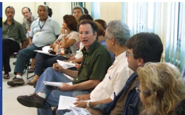
Grupão lotou auditório da Asfoc, no dia 20 de outubro

Em reunião do Conselho Deliberativo da Fiocruz, em 29 de outubro, foi aprovado, por unanimidade, as novas datas para a realização da primeira plenária do VI Congresso Interno: 7, 8 e 9 de abril de 2010. No entendimento dos integrantes do CD, as decisões que estarão em pauta no próximo Congresso não podem carecer de maior aprofundamento dos temas propostos e de maior segurança por parte de todos que participam dos debates.